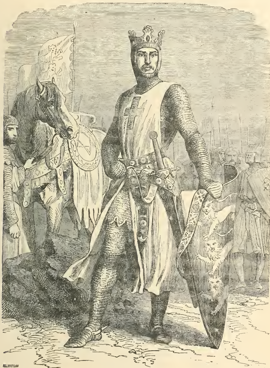
Richard Cœur de Lion.

grandes protestations de dévouement qu'il était le plus près de s'en séparer et de s'engager dans le parti contraire. Après avoir, selon les paroles d'un historien du temps, mangé à la même table que